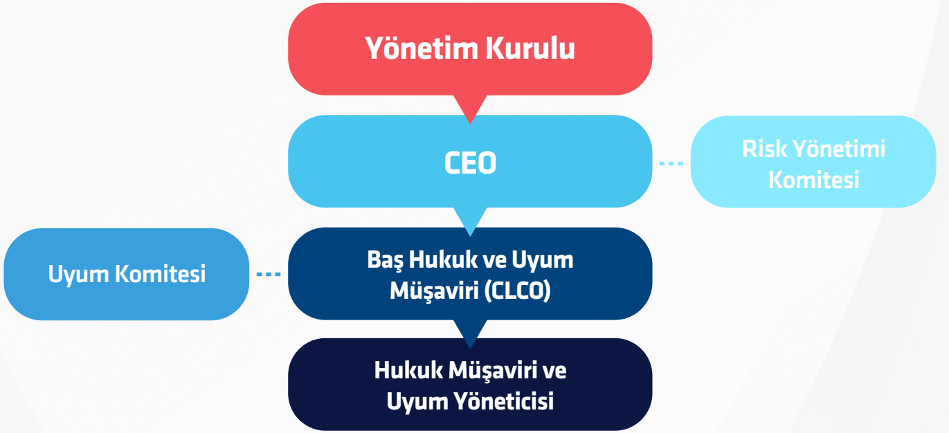
Şekil II: Entek Uyum Organizasyonu

Yukarıda görüldüğü gibi Uyum organizasyonun işlevleri: